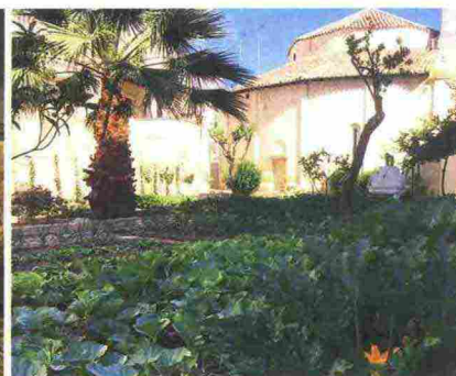
1. Uno scorcio del giardino terapeutico per malati di Alzheimer a Pistoia. 2. Salotto Swing di Ethimo su una delle terrazze dell'Hotel Park Hyatt a Milano. 3. Karina Atkinson, biologa scozzese eletta Donna dell'Anno 2017. 4. Il nuovo orto-giardino nel cuore di Brindisi.